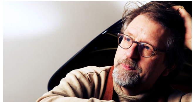
Lasse Thoresen, Komponist (Norwegen)

Neben den Meisterkursen und Konzerten sowie verschiedenen Präsentationen bietet das Symposium auch Zeit für