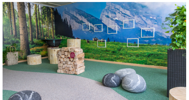
Flora-Fauna Zimmer

Im ersten Stock im einladenden Stübli mit einer Selbstbedienungstheke steht eine wundersame Klangbank, welche mit Körperkontakt gespielt werden kann. Trauen Sie sich und lassen Sie es klingen.