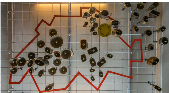
Der Schellenhimmel, gestaltet von Schmied Josef Brand

Im Erdgeschoss erstrahlt der Shop in neuem Gewand. Das Klangwelt Logo wurde perfekt von Hand an die Wand gemalt von Anita Engel.