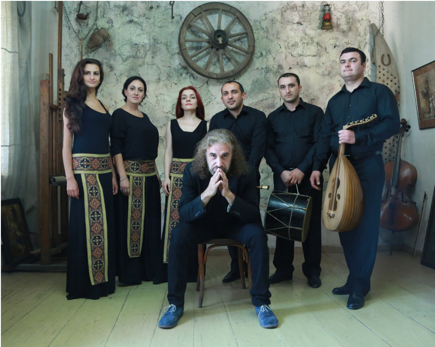
Naghash Ensemble aus Armenien

Die Stimme ist natürlich immer noch da – und wie – nur wird sie getragen und eingebunden von all den unzähligen Möglichkeiten der Instrumentierung in den verschiedensten Kulturen und Stilen.