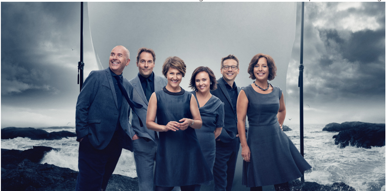
Das norwegische A-Capella-Ensemble Nordic Voices

Der Spezialist, wie auch der musikinteressierte Laie kann gleichermassen von dieser Woche profitieren. Die Vorträge