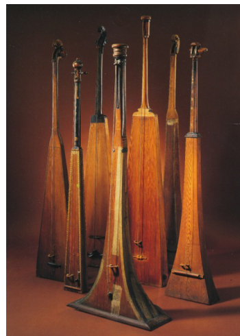
Trumscheit «Tromba di Marina»

Weitere Informationen auf klangwelt.swiss