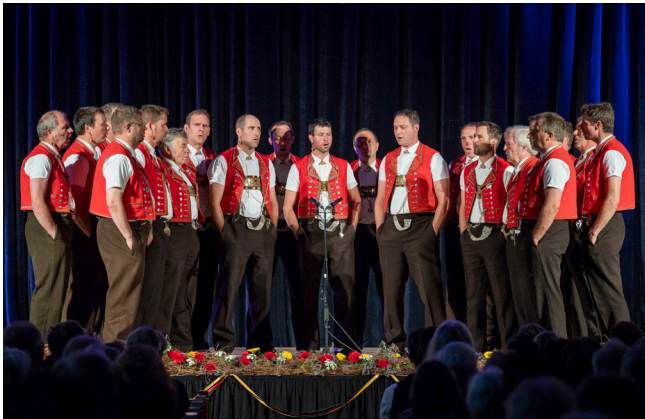
Jodelclub Säntisgruess, Unterwasser-Wildhaus

und der Tag «Gipfel der Naturtöne» am Klangfestival Togggenburg 2020 sind deshalb für alle Neugierigen offen und